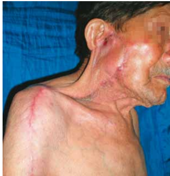
Fig. 5. Postoperatorio 3 meses: Buena integración del colgajo al sitio receptor.

El resultado de patología demostró un carcinoma de células escamosas infiltrante, moderadamente diferenciado, no queratinizante, sin invasión linfocelular. El nivel de profundidad fue de 12 mm, con todos los bordes de sección, incluyendo el del conducto auditivo externo, negativos para infiltración tumoral. Se disecaron 38 ganglios del vaciamiento del cuello, los cuales fueron negativos para malignidad. La evolución postoperatoria fue buena; sin embargo, la sonda de nelaton se desprendió del conducto, y este se obliteró. A los 3 meses postoperatorios fue controlado, y se encontró una excelente integración del colgajo, con buena función del músculo trapecio y del nervio espinal (Figura 5).