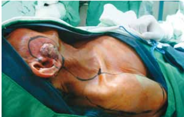
Fig. 2. Diseño de resección local y colgajo: Márgenes de resección de 20 mm; diseño fusiforme de colgajo fasciocutáneo de arteria supraclavicular.

El paciente es intervenido quirúrgicamente y se le realiza extirpación tumoral. En este procedimiento se le retiran parcialmente el pabellón auricular y la parótida superficial, aunque se preserva el nervio facial en su totalidad; todo esto, acompañado de vaciamiento de cuello supraomohiideo ipsilateral. Seguidamente se diseñó un colgajo en isla de la arteria supraclavicular derecha, para reconstruir el defecto quirúrgico; el colgajo es en forma fusiforme o de raqueta, como ya se describió (3) (Figura 2).