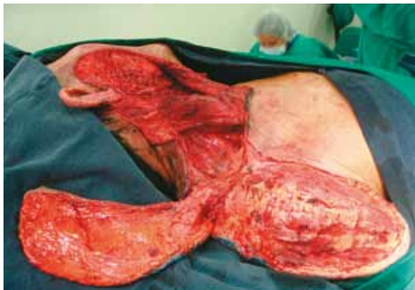
Fig. 3. Colgajo fasciocutáneo en isla de arteria supraclavicular: As clavicular de músculo trapecio desinsertado.

Para lograr la rotación de 180 grados se introdujo una modificación adicional a este colgajo, consistente en el desprendimiento de los haces clavicular inferiores del músculo trapecio, pero conservando la inervación del nervio espinal, así como la circulación de los vasos cervicales transversos y supraclaviculares (Figura 3). Durante la fijación del colgajo se dejó una sonda de nelaton en el conducto auditivo externo, como férula (Figura 4).