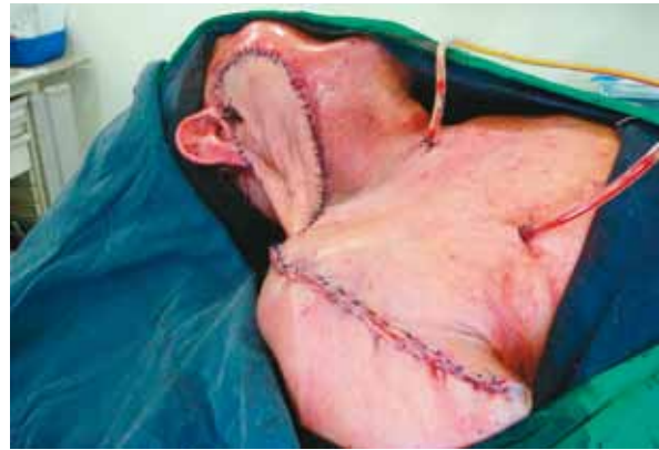
Fig. 4. Postoperatorio inmediato: Cierre del sitio donante y férula del conducto auditivo externo.

El resultado de patología demostró un carcinoma de células escamosas infiltrante, moderadamente diferenciado, no queratinizante, sin invasión linfocelular. El nivel de profundidad fue de 12 mm, con todos los bordes de sección, incluyendo el del conducto auditivo externo, negativos para infiltración tumoral. Se disecaron 38 ganglios del vaciamiento del cuello, los cuales fueron negativos para malignidad. La evolución postoperatoria fue buena; sin embargo, la sonda de nelaton se desprendió del conducto, y este se obliteró. A los 3 meses postoperatorios fue controlado, y se encontró una excelente integración del colgajo, con buena función del músculo trapecio y del nervio espinal (Figura 5).