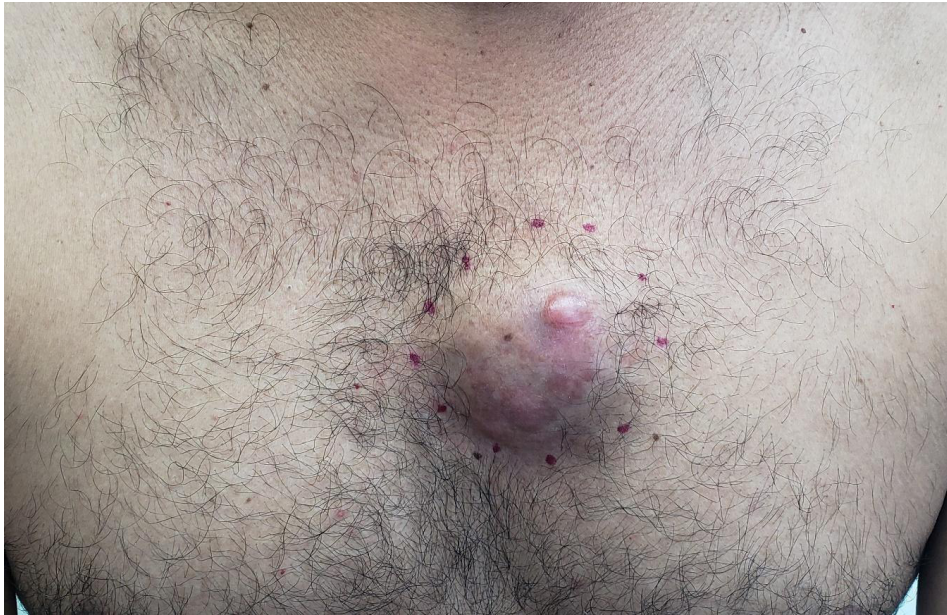
Figura 1. DFSP en el pecho de un hombre adulto. La lesión exhibe características típicas: un tumor firme con áreas eucrómicas y áreas rosadas, cuyo mayor volumen está en la dermis y el tejido celular subcutáneo.