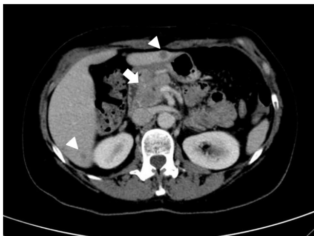
Figura 1 TC con una masa en cabeza de páncreas y dos metástasis hepáticas.

Se ha presentado el caso de una pancreatitis aguda inducida por metástasis como manifestación inicial de un cáncer de células pequeñas de pulmón. El primer caso de esta causa rara de pancreatitis aguda fue descrito en 1976 1 . Las causas