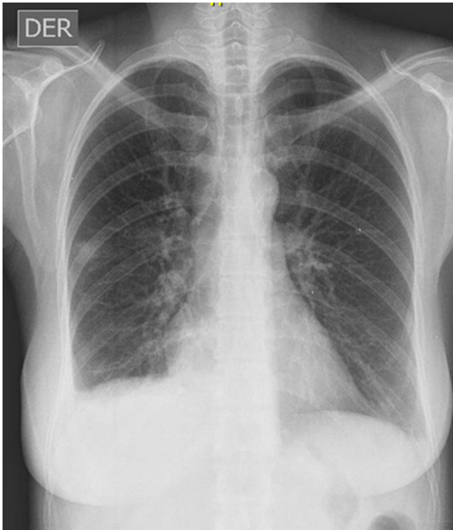
Figura 1 Radiografía de tórax PA que evidencia silueta cardíaca normal y obliteración de receso costofrénico lateral y posterior derecho.