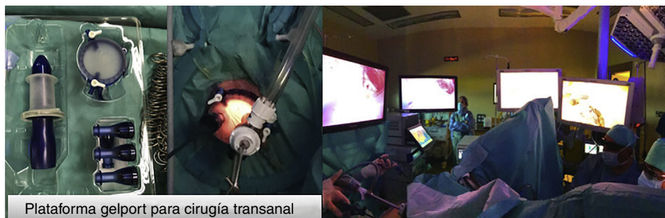
Figura 2 Imágenes de la plataforma de cirugía transanal. Equipo quirúrgico realizando la exéresis quirúrgica por TAMIS ( Transanal Minimal Surgery ).

realización linfadenectomías, ya que las metástasis ganglionares son infrecuentes. Por el mismo motivo no está indicada la excisión total mesorrectal. Desde el punto de vista técnico debe tenerse en cuenta que se trata de lesiones con una pseudocápsula, friables, debiéndose extremar las medidas y evitar su rotura ya que si se produce, empeora el pronóstico 5 .